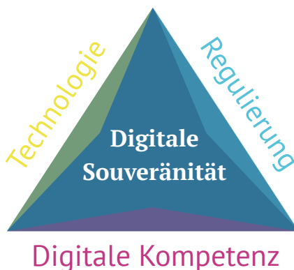
Abbildung 1: Dreieck der Digitalen Souveränität: Technologie, Digitale Kompetenz und Regulierung (eigene Darstellung)

Regulierung umfasst sowohl Rechte und Pflichten des einzelnen Verbrauchers sowie Rechte und Pflichten von Unternehmen und Staat. Rechte und Pflichten des einzelnen Verbrauchers beziehen sich dabei beispielsweise auf das Recht auf Datenlöschung und Datenportabilität sowie die Pflicht zur Installation von Sicherheitsupdates auf Internet-of-Things-Geräten. Rechte und Pflichten von Unternehmen und Staat beziehen sich insbesondere auf Transparenz und Zweckbindung bei der Datenerhebung und Datenverwendung sowie Überprüfbarkeit und Offenlegung von Algorithmen beispielsweise im Rahmen von Algorithmen-Audits, wie sie heute bereits im Bereich des Kredit- und Bonitäts-Scorings praktiziert werden.