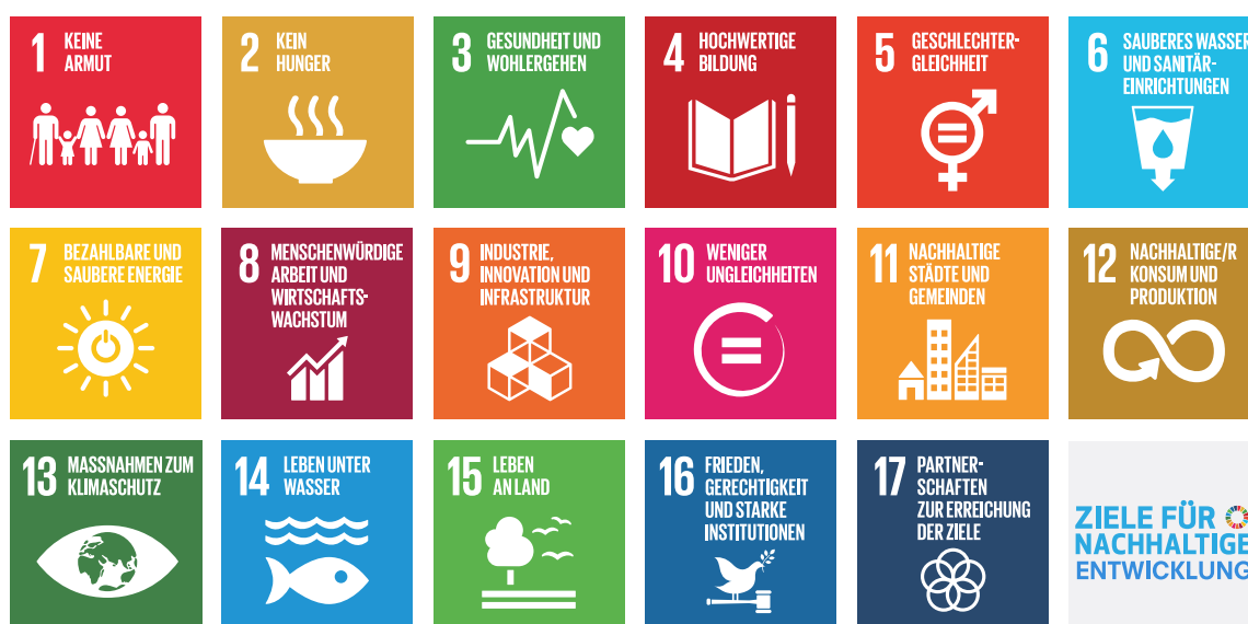
Abb. 1: Die SDGs im Überblick (Stand 2020)

Die Politik hat den damit angesprochenen Transformationsprozess seit einiger Zeit im Blick. Einen wesentlichen Referenzpunkt bilden dabei die im September 2015 von den Vereinten Nationen verabschiedeten 17 Sustainable Development Goals (SDG) , die mit nicht weniger als 196 Unterzielen verbunden sind. Diese enthalten konkrete Zielnennungen und fordern deren Umsetzung in nationale Politiken und Maßnahmen. Das Jahr 2030 wurde dabei als Zieldatum fixiert. Bis zu die-